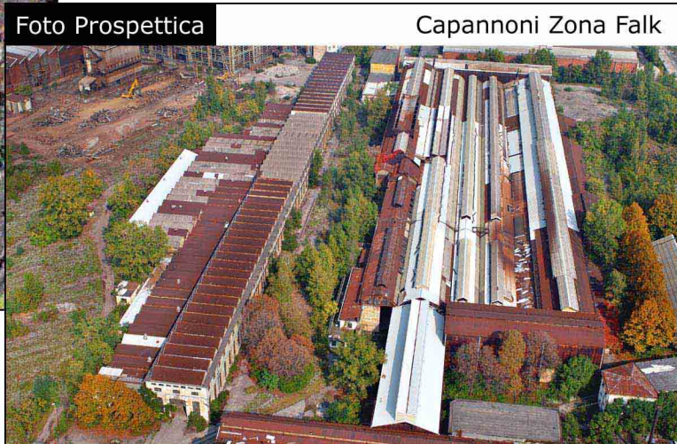
Capannoni Zona Falk

Tutte le immagini verranno inserite su CD-Rom ■ per una maggiore consultazione tecnica con coordinate geografiche georeferenziate su ogni singolo file.